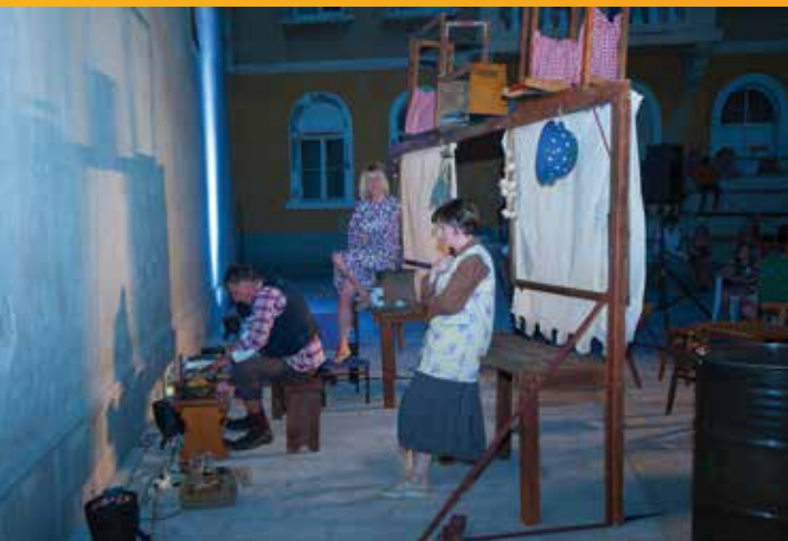
KAZALIŠNA PREDSTAVA "ROMANCA O TRI LJUBAVI"