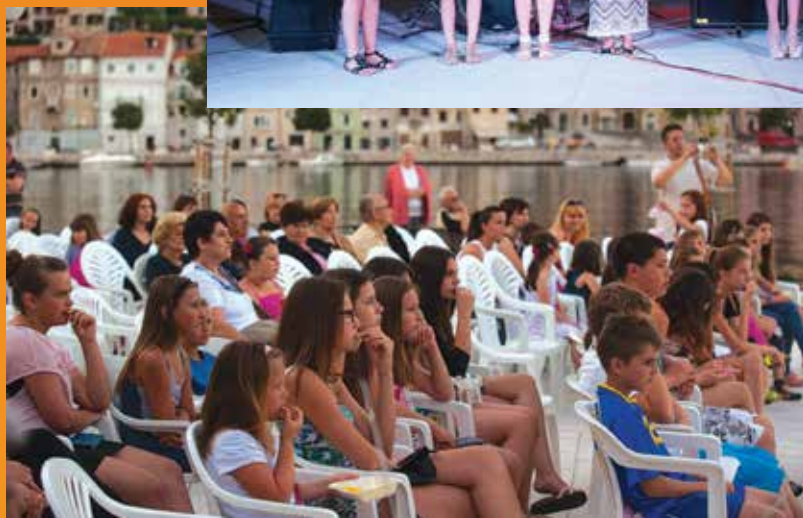
Dječji festival Astra