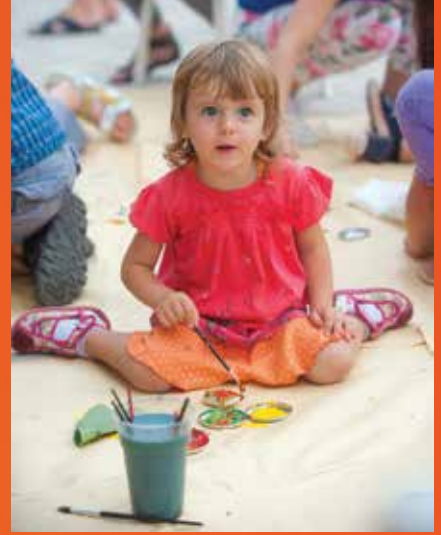
Likovna radionica u organizaciji Društva "Naša Djeca" Bakar