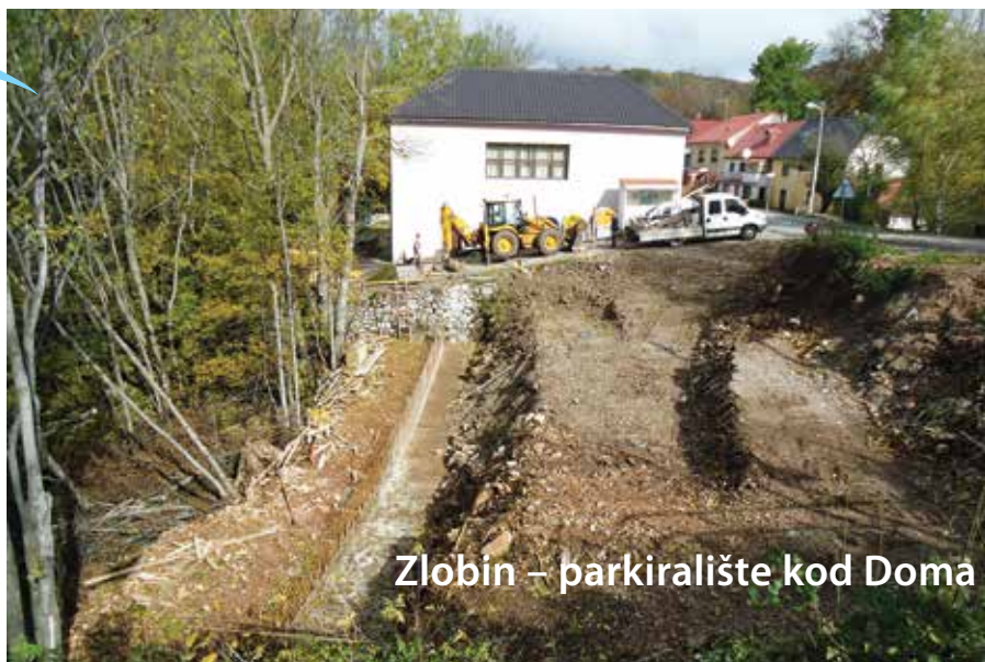
Zlobin – parkiralište kod Doma

Započeli su radovi na izgradnji parkirališta uz Dom kulture u Zlobinu. Planirano je radove izvoditi u dvije faze. U ovoj godini izgradit će se potporni zidovi i nasip, a završetak radova i asfaltiranje predviđaju se u sljedećoj, 2017. godini. Na površini parkirališta obilježiti će se parkirna mjesta za 16 automobila uključujući i mjesta za osobe s invaliditetom. Očekujemo da će se izgradnjom parkirališta riješiti problem ostavljanja vozila na uskom kolniku županijske ceste te omogućiti lakša organizacija događanja u Domu kulture i mjestu.