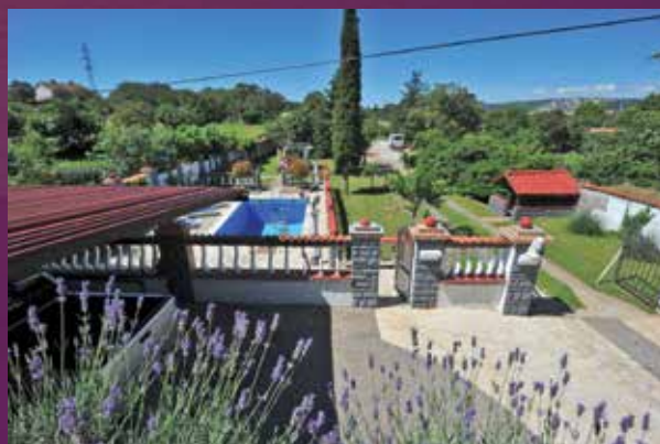
Petar Polić, Krasica (NAGRADA: 500,00 kuna)