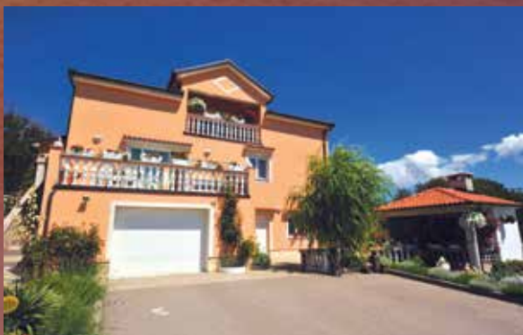
1. mjesto – Josipa Crnković, Škrljevo (NAGRADA: 650,00 kuna)