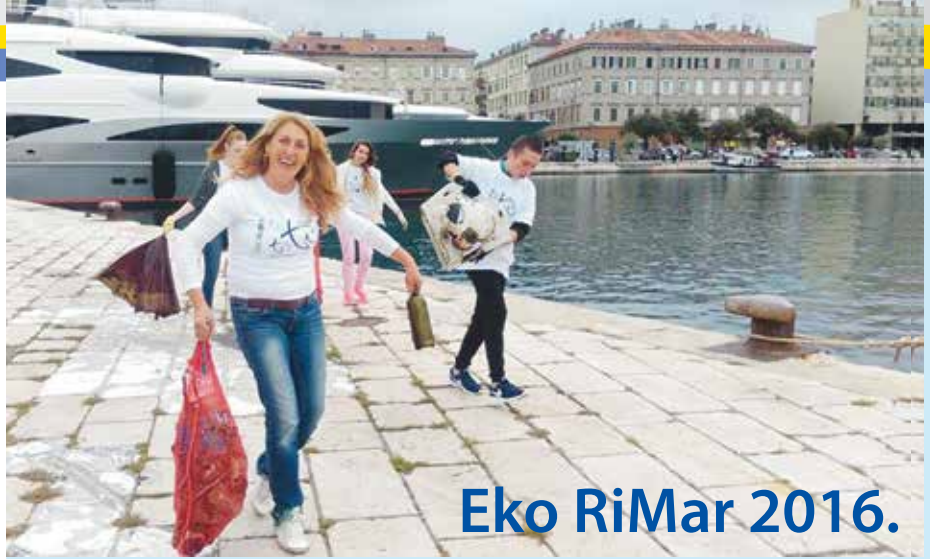
Eko RiMar 2016.

Pomorska se škola Bakar rado odazove na pozive za sudjelovanje u ekološkim akcijama. Redovito sudjelujemo u velikoj akciji čišćenja riječke luke Eko RiMar. Ove se godine održala u subotu 8. listopada, a među mnogobrojnim volonterima ljubiteljima mora bilo je i naših učenika i nastavnika iako je bio neradni dan. Ciljevi su akcije očuvanje prirode i zaštita čovjekova okoliša kao temeljnih vrijednosti društva i razvijanje odgovornosti i angažman građana da more ne smije biti odlagalište otpada. Stotinjak je ronilaca zaronilo i vadilo otpad iz riječkog podmorja u luci. Među volonterima na kopnu bili smo i mi, učenici i nastavnici Pomorske škole Bakar. Dobili smo zaštitne rukavice pa smo lakše taj otpad preuzimali od ronioaca i odlagali u kontejnere. Bilo je tu nekoli-