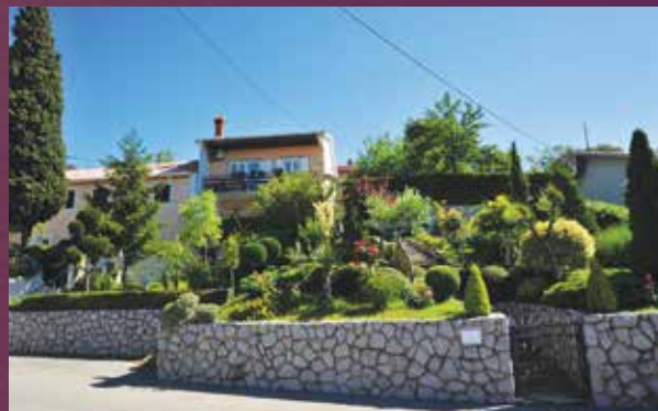
Zoran Pavlečić, Kukuljanovo (NAGRADA: 1.200,00 kuna)