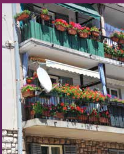
3. mjesto – Milodarka Grujić, Bakar (NAGRADA: 350,00 kuna)