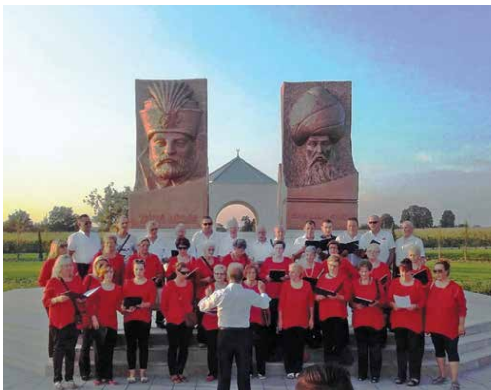
„Sloga“ i „Martin Matetić“ nastupili su kao združeni zbor u kulturnom