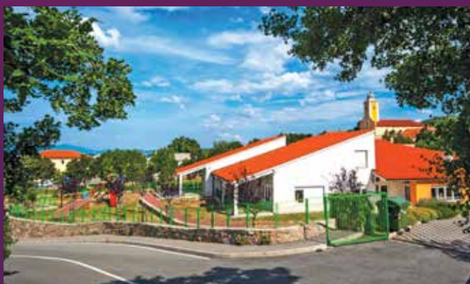
NAJLJEPŠE UREĐEN OKOLIŠ GOSPODARSKOG SUBJEKTA: DJEČJI VRTIĆ „HRELJIN“

Zahvaljujemo svima koji su sudjelovali u akciji i time doprinijeli uljepšanju naših mjesta na području Grada Bakra.