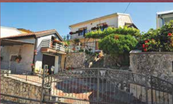
2. mjesto – Ivanka Uremović, Kukuljanovo (NAGRADA: 500,00 kuna)