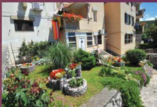
2. mjesto – Ludmila Kezić, Bakar (NAGRADA: 800,00 kuna)