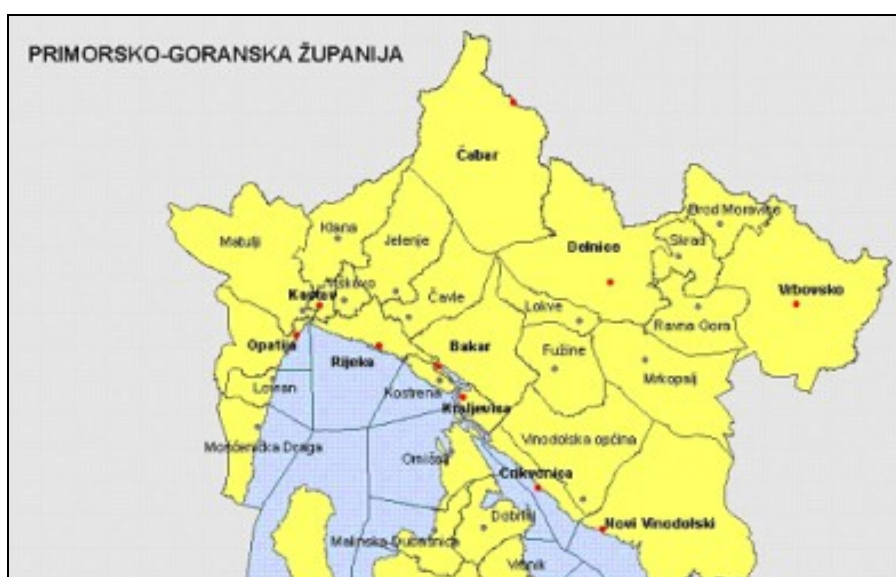
Slika 3. Prijedlog područja Urbane aglomeracije Rijeke

Temeljem dostignute razine suradnje putem komunalnih društava, kao i suradnji u razvoju prometne i komunalne infrastrukture, Grad Rijeka predlaže ustrojavanje urbane aglomeracije Rijeka na području kojeg čine: Grad Bakar, Općina Čavle, Općina Jelenje, Grad Kastav, Općina Klana, Grad Kraljevica, Općina Kostrena, Općina Lovran, Općina Matulji, Općina Mošćenička Draga, Općina Omišalj, Grad Opatija i Općina Viškovo.