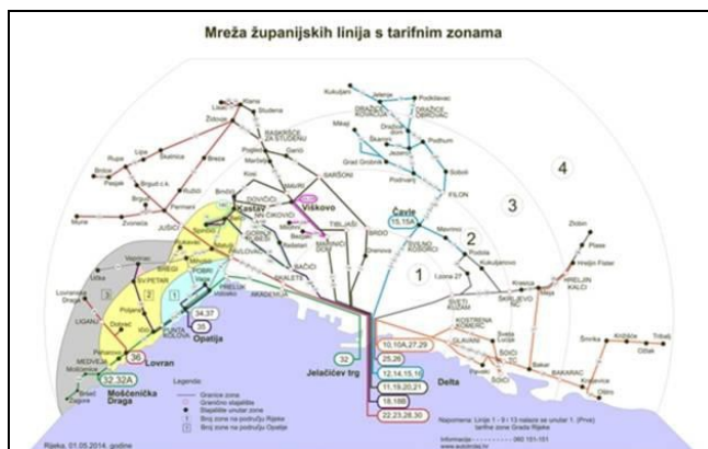
Slika 2. Mreža županijskih linija s tarifnim zonama

Na 2. slici može se vidjeti postojeća mreža županijskih autobusnih linija koje povezuju urbano područje oko Rijeke.