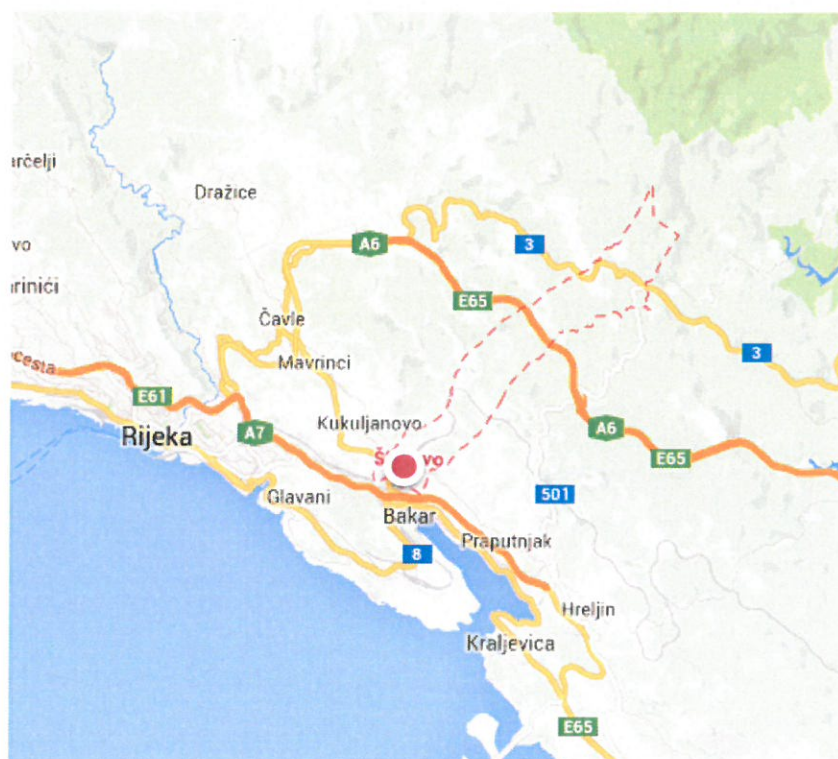
Slika 1. Zemljopisni položaj Škrljeva s naznačenom lokacijom objekta

Buduća lokacija vatrogasnog doma Škrljevo nalazi se na Škrljevu - naselju u sastavu jedinice lokalne samouprave Grada Bakra (Slika 1.). Područje Grada Bakra smješteno je u priobalnom dijelu Primorsko-goranske županije, a graniči s gradovima Rijekom i Kraljevicom, te općinama Kostrena, Čavle, Lokve, Fužine i Vinodolska. U sastavu Grada nalazi se 9 naselja i to Bakar, Hreljin, Krasica, Kukuljanovo, Plosna, Ponikve, Praputnjak, Škrljevo i Zlobin. Administrativno središte je Bakar.