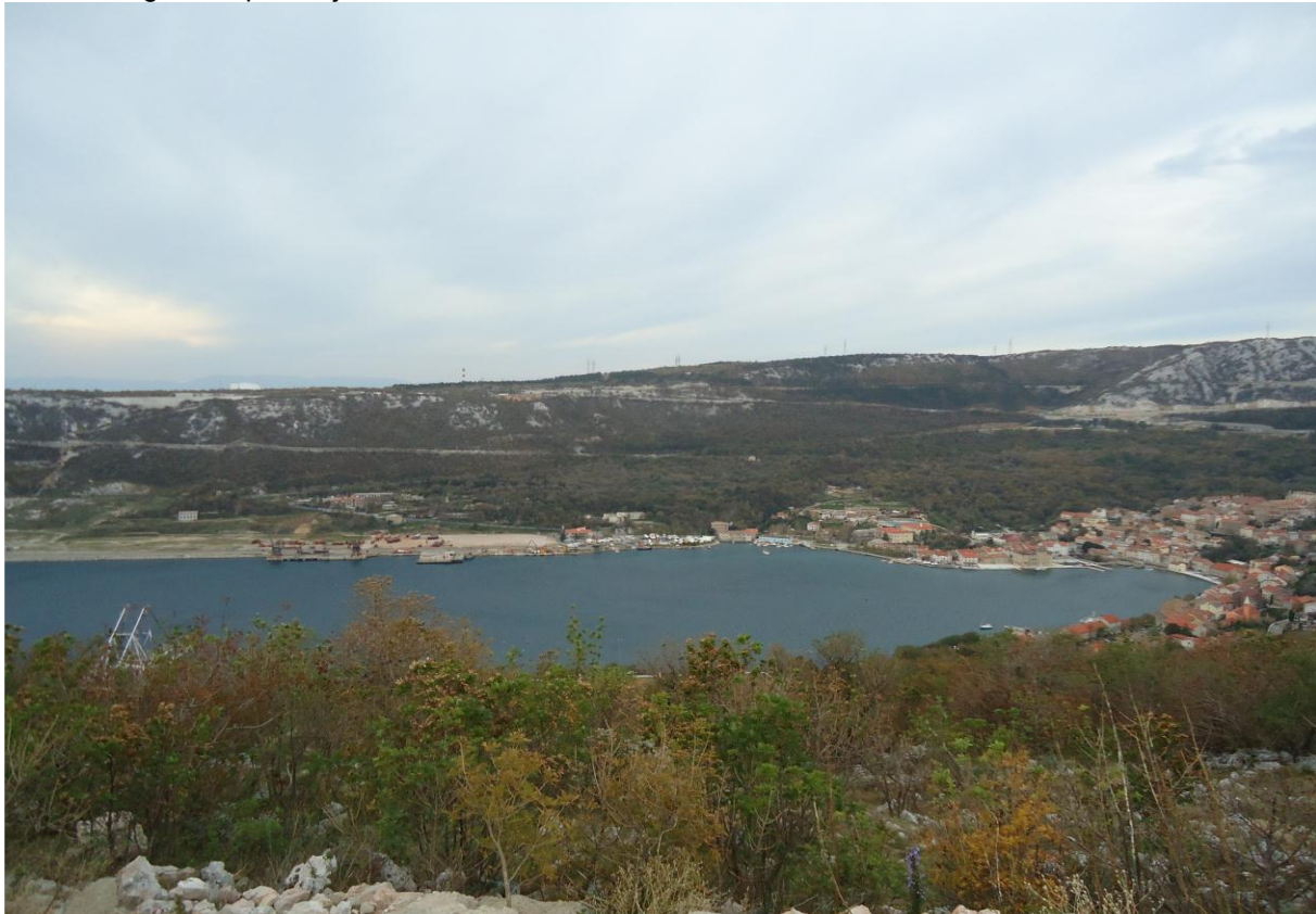
Slika 2: Pogled na područje obuhvata Plana