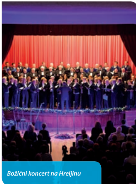
Božićni koncert na Hreljinu

rezervne pomoći i velikog entuzijazma svih članova udruga s područja Grada Bakra kojima ovim putem zahvaljujemo na pomoći i čestitamo na uspješno realiziranim programima.