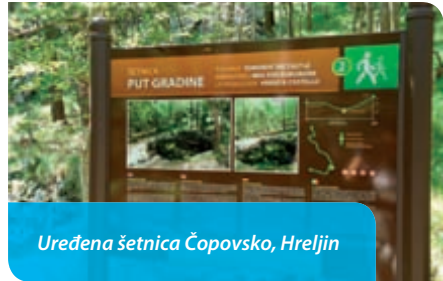
Uređena šetnica Čopovsko, Hreljin