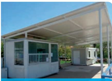
Uređeno bočalište na Hreljinu

Za budući sportsko rekreacijski centar Grada Bakra osigurali smo zemljište, napravili projekte prometnog rješenja i projektni zadatak.