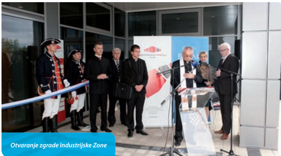
Otvaranje zgrade Industrijske Zone

premu za ulazak u Europsku uniju. Uveli smo najniže stope za obračun komunalne naknade proizvodnim djelatnostima i još čitav niz mjera. Smanjili smo komunalni doprinos i omogućili obročnu otplatu tvrtkama koje su svoje sjedište registrirale na području Grada Bakra. Gospodarstvenicima koji su za takav model iskazali interes omogućili smo i ugovaranje „Prava građenja“ po povoljnim uvjetima umjesto otkupa zemljišta. Sve ove godine financiramo i projekte u pčelarstvu. Osnivanjem Turističke zajednice i otvaranjem Turističkog ureda stvorili smo preduvjete i za ovu vrstu djelatnosti. Prostorno-planskom dokumentacijom i ugovorenim izradom novih Urbanističkih planova budućih zona poslovne namjene te rješavanjem imovinsko-pravnih odnosa za zemljišta namijenjenog gospodarstvu osigurali smo nesmetan i ubrzan razvoj našeg Grada. Pred Gradskom upravom su još brojni izazovi i novi projekti koje tek treba realizirati, a koje pored svega što je odrađeno