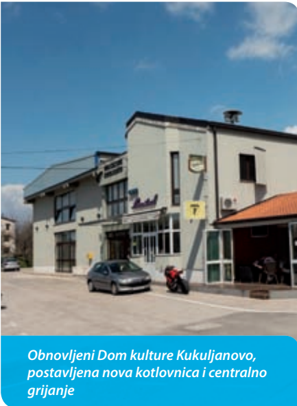
Obnovljeni Dom kulture Kukuljanovo, postavljena nova kotlovnica i centralno grijanje