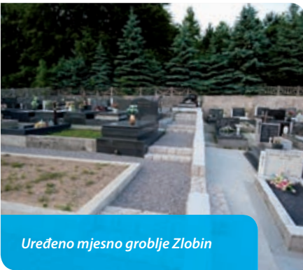
Uređeno mjesno groblje Zlobin

Izvješće smo podijelili u poglavlja kojima smo nastojali obuhvatiti sve segmente našega rada tako da su opisani svi resori Gradske uprave kao i sva društva i ustanove u vlasništvu Grada Bakra kojima smo upravljali.