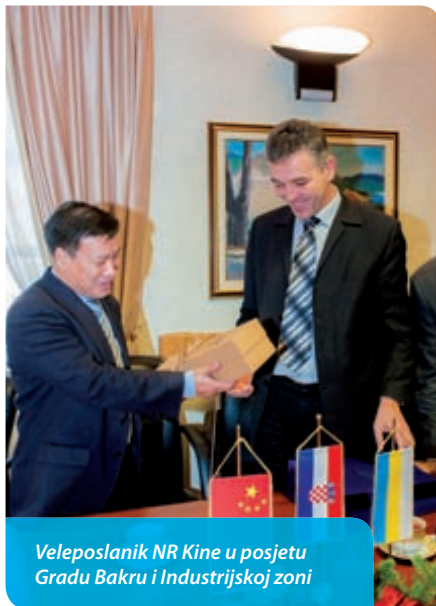
Veleposlanik NR Kine u posjetu Gradu Bakru i Industrijskoj zoni

Smanjen doprinos za otvaranje novih poduzetničkih objekata sa sjedištem u Gradu Bakru