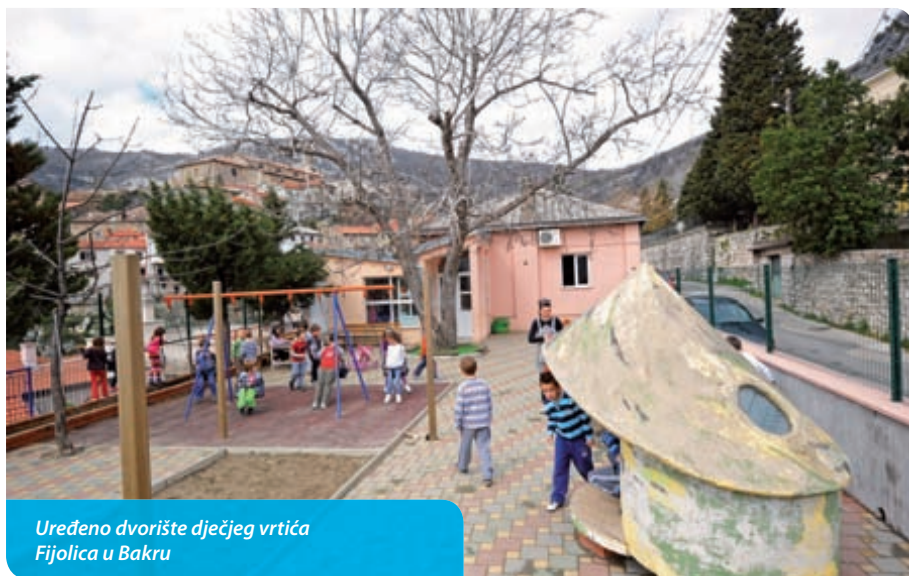
Uređeno dvorište dječjeg vrtića Fijolica u Bakru