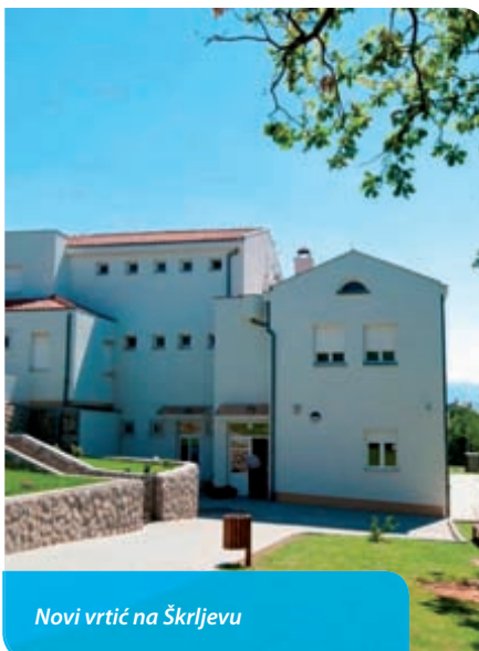
Novi vrtić na Škrljevu