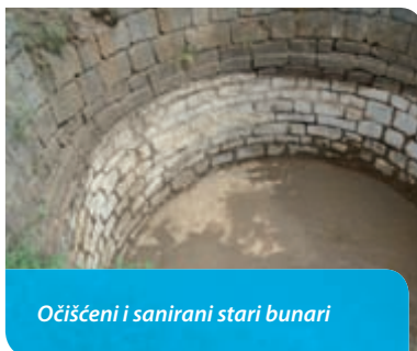
Očišćeni i sanirani stari bunari

U ovom mandatu najteža bitka za Bakar vodila se, možemo reći, upravo s najjačim suparnikom. Još je živo u sjećanju da su INA, MOL, Županija i Ministarstvo pokrenuli tijekom 2010. i 2011. godine projekt izgradnje Luke za petrol-koks u Bakarskom zaljevu. Oštro smo krenuli u borbu za naš kraj. Nismo žalili niti vrijeme, a ni sebe u nastojanju da spriječimo daljnje uništenje predivne Bakarske vale. Nebrojani su kontakti i lobiranja, deseci stranica naših apela i dopisa. Nismo pristali, a snagu smo našli u jedinstvu svih građana Bakra i njihovoj čvrstoj podršci. U Bakarskom zaljevu neće se graditi nova luka za petrol-koks, zaljev je sačuvan, a s njim i naša kulturna i povijesna baština. Sličan projekt koji bi nepovratno uništio naš zaljev bio je i projekt oborinske odvodnje s brze ceste iznad Bakra. Tim projektom i već dobivenom građevinskom dozvolom, kao i započetim radovima na izgradnji kolektora kod Takala, sve vode i kanali-