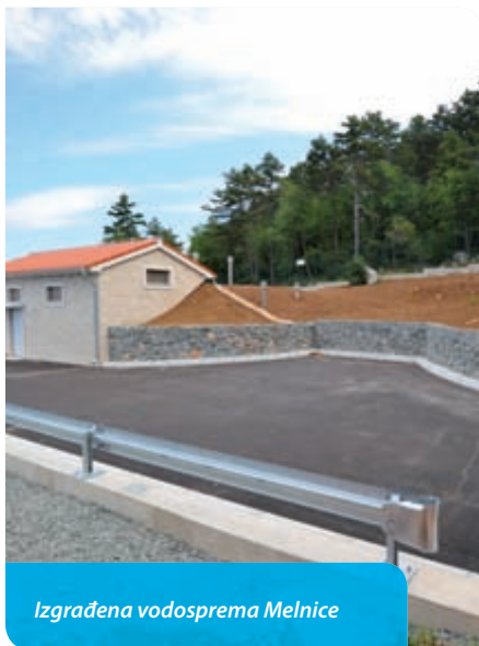
Izgrađena vodosprema Melnice