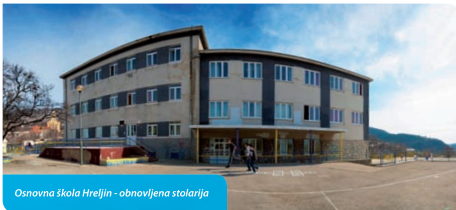
Osnovna škola Hreljin - obnovljena stolarija

u proteklom mandatu osigurao sredstva za korisnike slabijeg imovinskog statusa kojima smo pomagali plaćanje vrtića, a sve u cilju da naša djeca imaju djetinjstvo kakvo zaslužuju.