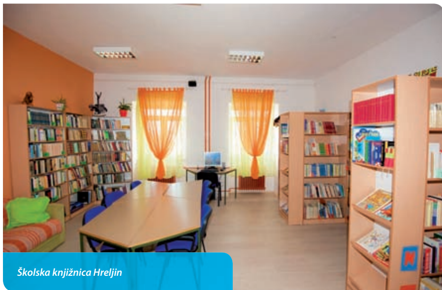
Školska knjižnica Hreljin