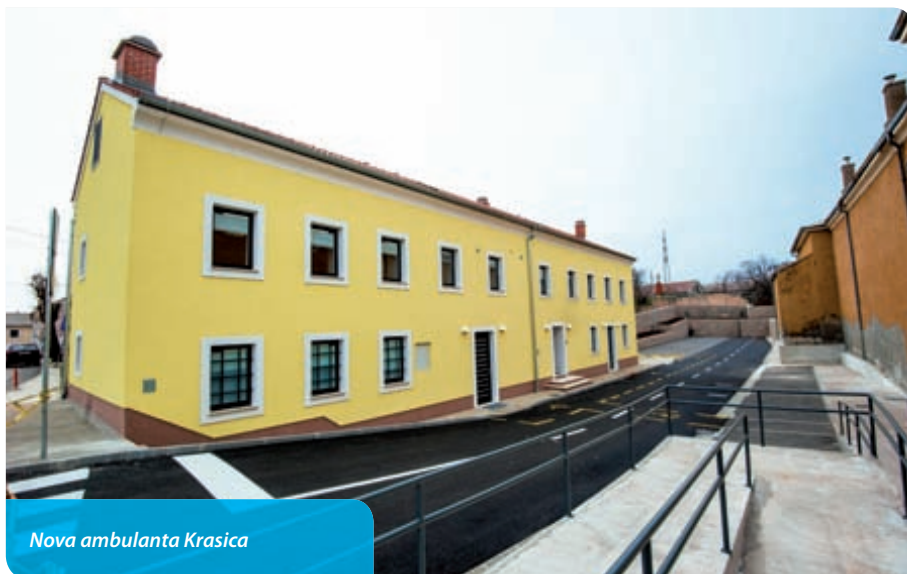
Nova ambulanta Krasica