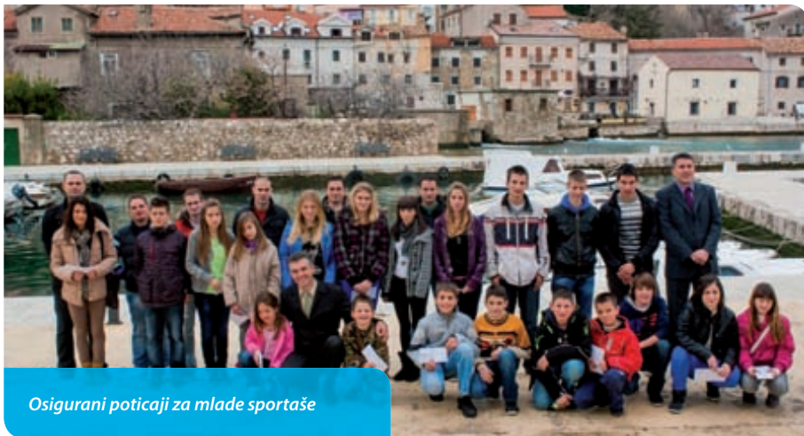
Osigurani poticaji za mlade sportaše

Sportske udruge i sportaši Grada Bakra svake nam godine podare velike rezultate, bili oni ekipni ili pojedinačni. Na taj su način zacijelo najbolji promotori svoga mjesta i kraja. Vodeći brigu o sportašima i svim udrugama s našega područja, osigurali smo sredstva za njihovo kvalitetno funkcioniranje, za njihove treninge, natjecanja i organizaciju sportskih priredaba. Sportski klubovi Grada Bakra prepoznatljivi su i iznimno uspješni u svojim natjecateljskim ligam. Raduje činjenica da su gotovo svi klubovi u protekle četiri godine ostvarili rezultatske pomake. Posebno smo osiguravali sredstva za pomoć u treniranju, putovanjima ili nagrada sportašima iz pojedinačnih sportova te možemo zadovoljno reći da su među njima i djeca koja su postala državni prvaci a naš Bakranin Zoran Talić osvajač i