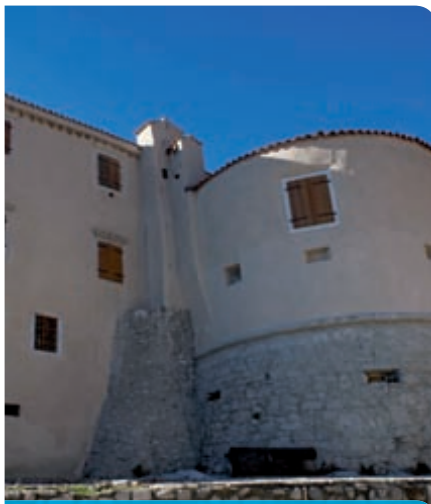
Nastavljena revitalizacija bakarskog kaštela