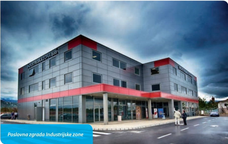
Poslovna zgrada Industrijske zone