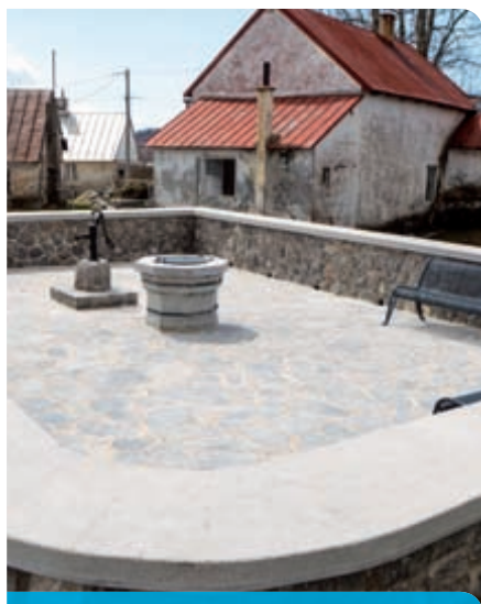
Obnovljena pučka šterna na Zlobinu