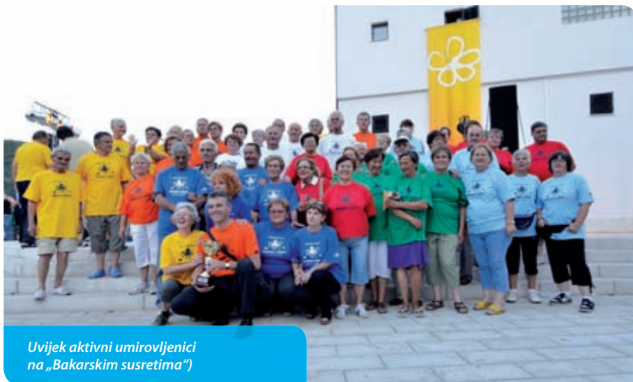
Uvijek aktivni umirovljenici na „Bakarskim susretima“

Umirovljenici s najmanjim primanjima redovito svakog mjeseca iz Proračuna Grada primaju novčanu pomoć u iznosima 200 ili 400 kuna izravno na svoj račun. Prostornim planom Grada Bakra i izradom Urbanističkoga plana osigurano je komunalno i infrastrukturno opremljeno zemljište i prostor površine 5000 m 2 za izgradnju Doma za starije osobe te je u našim planovima, naravno u suradnji s privatnim partnerom, pokrenuti i njegovu konačnu izgradnju.