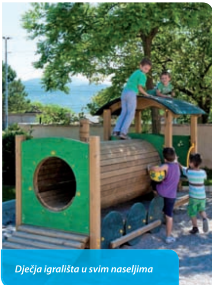
Dječja igrališta u svim naseljima