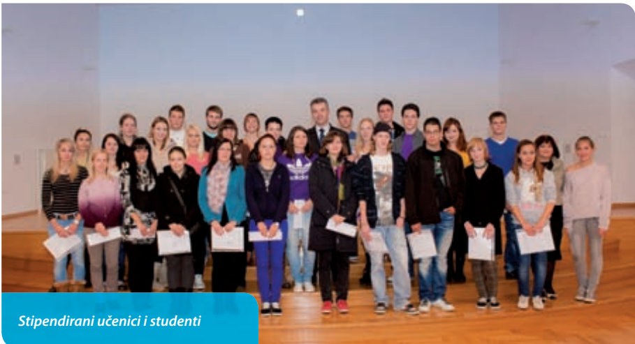
Stipendirani učenici i studenti