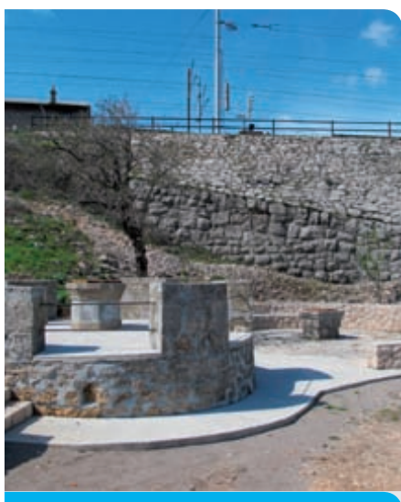
Uređena pučka šterna u Škrljevu