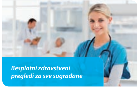
Besplatni zdravstveni pregledi za sve sugrađane