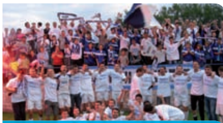
NK Naprijed Hreljin