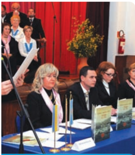
Kroz izdavanje monografije obilježeno 100 godina djelovanja KUD Sloga Hreljin