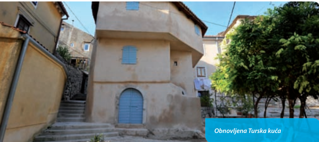
Obnovljena Turska kuća