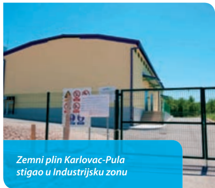
Zemni plin Karlovac-Pula stigao u Industrijsku zonu