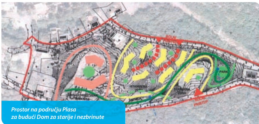
Prostor na području Plasa za budući Dom za starije i nezbrinute