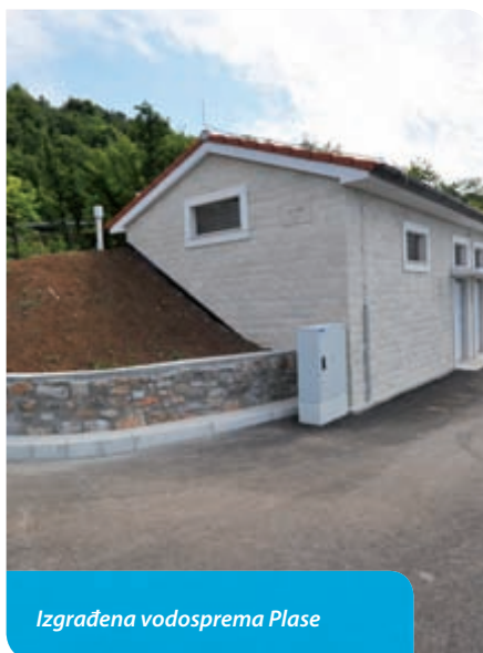
Izgrađena vodosprema Plase