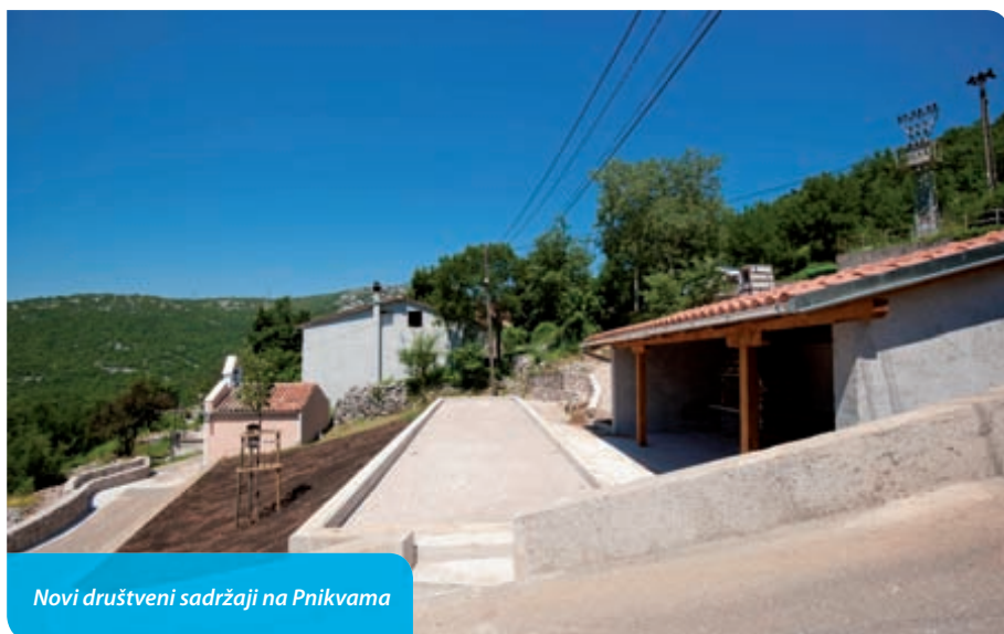
Novi društveni sadržaji na Pnikvama