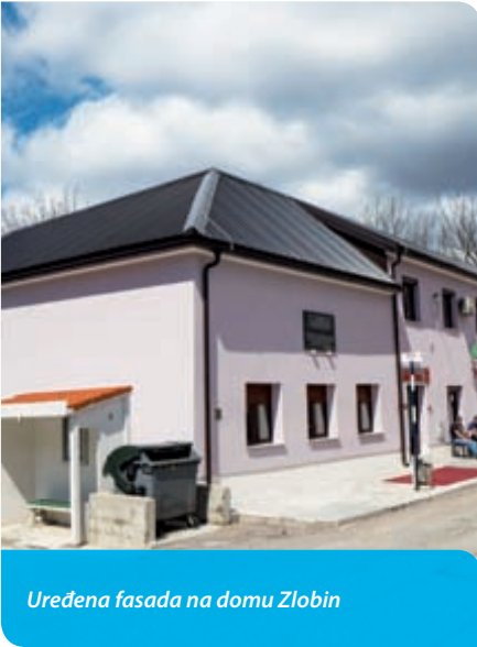
Uređena fasada na domu Zlobin