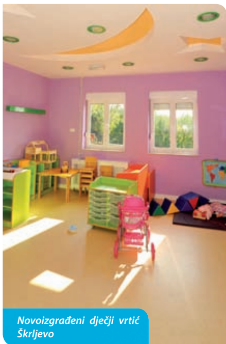
Novoizgrađeni dječji vrtić Škrljevo