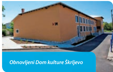
Obnovljeni Dom kulture Škrljevo