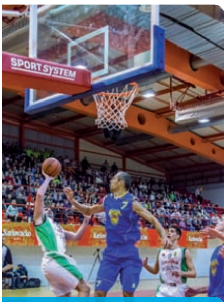
KK Škrljevo - prvak druge lige