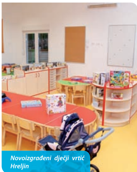
Novoizgrađeni dječji vrtić Hreljin