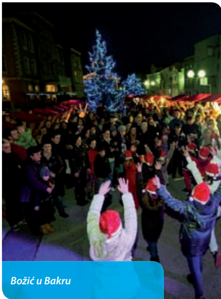
Božić u Bakru