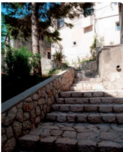
Popločena stara gradska jezgra u Bakru