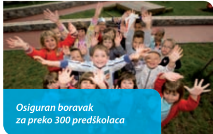
Osiguran boravak za preko 300 predškolaca