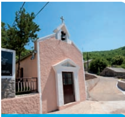
Uređen centralni dio naselja Ponikve