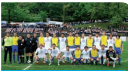
NK Borac i HNK Rijeka u humanitarnoj utakmici 2010